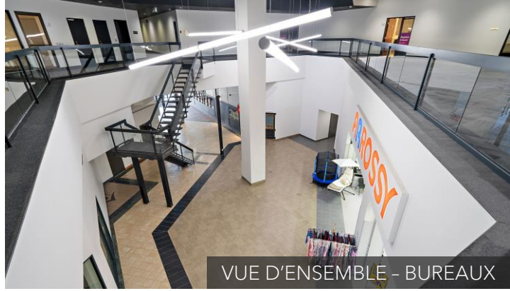
VUE D'ENSEMBLE - BUREAUX