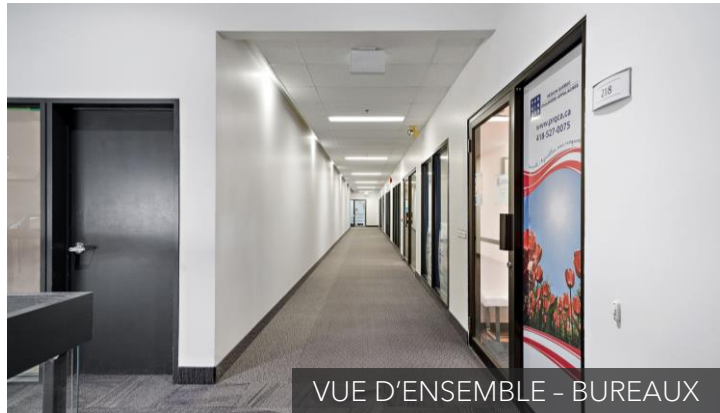
VUE D'ENSEMBLE - BUREAUX